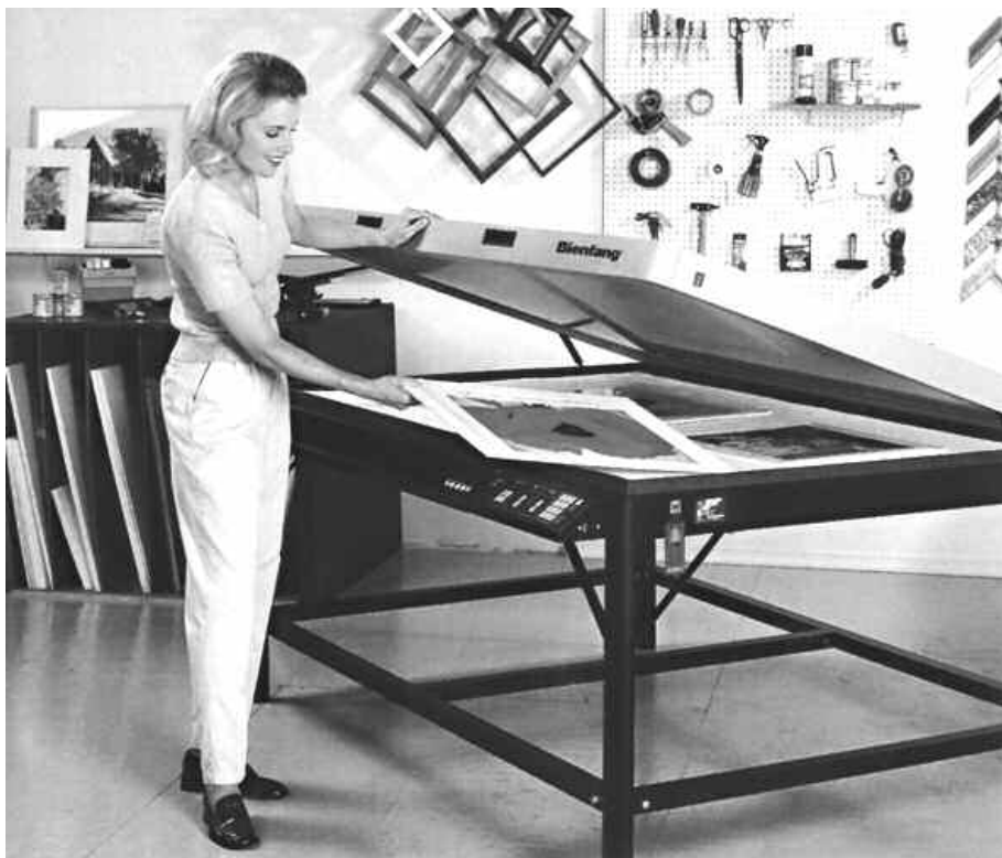
Mesa de laminação e adesivagem DRY MOUNT .

Manter as placas sempre longe da umidade e da luz direta do sol